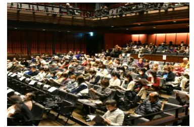
第32回 コンクール会場風景