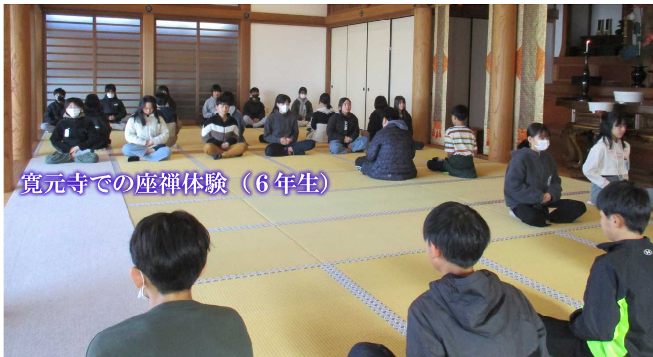
寛元寺での座禅体験 (6年生)

1学期に2年生は「まちたんけん」、3年生は「校区の様子」の学習で寛元寺を訪問し、座禅体験を行っています。今回は、6年生が座禅（坐禅）体験を行いました。