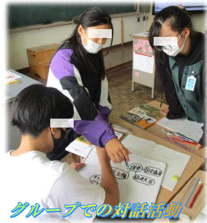
グループでの対話活動

さて、本年度の重点目標は「 自分の考えをつくり、わかり合う子どもの育成 」としました。