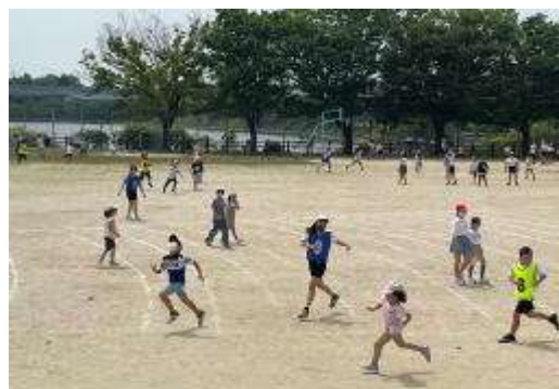
昼休みの様子（低学年「けいどろ大会」）

子ども達はよく遊びます。毎日の遊びを通して、たくさんのことを勉強しています。特に今年は外で遊ぶ子ども達が多いようです。これからも子ども達が「元気に遊ぶ」北小であってほしいです。