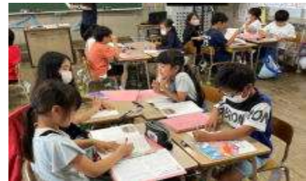
きき合いタイム (3年2組)の様子

一度にそういう集団ができるとは思っていません。毎日の学習や生活の中で、徐々に作り上げていくものだと思っています。私たち教職員はそのための研修を日々積んでいきたいと考えています。