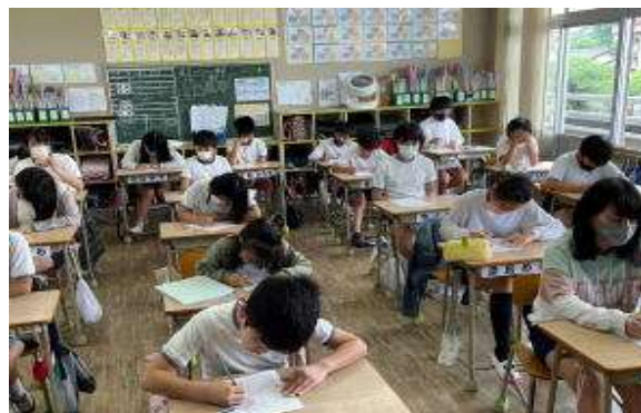
「習熟の時間」の様子（6年1組）