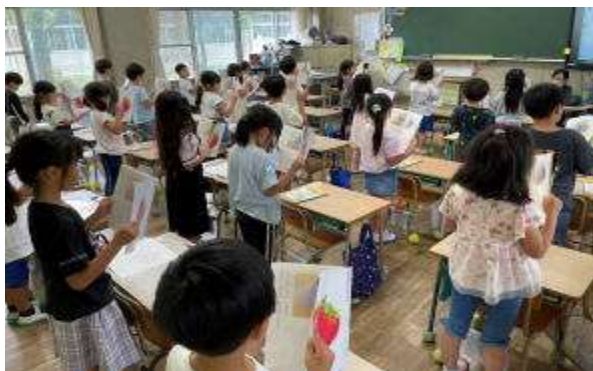
「習熟の時間」の様子（1年1組）

北小では、本年度から「習熟の時間」を週時程の中に1時間設け、基礎学力に特化した授業を行っています。どの学級でも、子ども達の真剣に学習に取り組む姿を見ることができます。