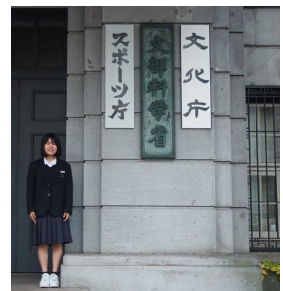
↑文部科学省前にて