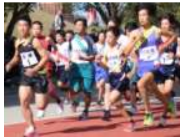
男女スタートの様子