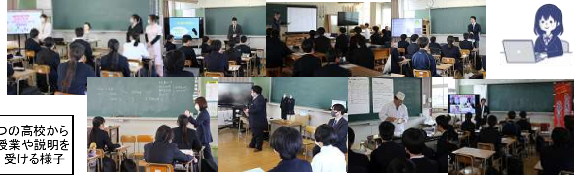
8つの高校から授業や説明を受ける様子

◎2年生は、3月4日(月)『キャリア教育』の一環として、私立高校8校(祐誠、久留米学園、八女学院、西日本短大付属、柳川、杉森、大牟田、誠修)の先生方から、各高校の特色の説明や実際の授業を体験する等の「出前授業」を開催しました。これまでに、学級活動や総合学習の時間等を使い、調べてきた情報と照らしながら、自分の将来の目標や夢の実現に向けて、適切な進路選択を考える学習となりました。今後は、これからの1年間を、「どのように過ごし、自分に合った進路を選択し、その実現のためには、どれくらいの努力を要するのか？」等、真剣に考えて学校生活や家庭生活を送って欲しいと思います。そして、1年後には、学級や学年の皆で進路実現を果たし、「喜び合える」ことを目標にして欲しいと期待しています。