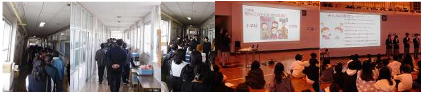
校舎内を案内する中学3年生と小学生の様子と中学校生活等についての質問に答える中学生の様子

◇卒業していく生徒がいる一方で、入学してくる生徒(新1年生)がいます。残念ながら古島小が、インフルエンザによる学年閉鎖により急遽不参加となりましたが、校区内5小学校の6年生152名が、2月20日、中学校に来校し、授業の様子や部活動を見学しました。また、中学3年生から、中学校生活への不安をできるだけ少なくし、希望を持って入学できるように、中学校生活について説明したり、小学生からの事前の質問に答えたりする等、貴重な体験の機会として行事を開催しました。中には、他校へ進学する児童もいるわけですが、それぞれの進学先でたくましく成長してほしいと願いますし、今まで同じ小学校で過ごした仲間との交流も大切にしてほしいと思います。筑後中でも、しっかりと入学の準備を整えて、温かく迎えたいと考えております。