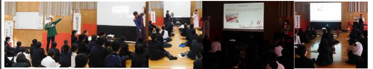
(左から)コンビニ、消防士、美容師、看護師、野菜ソムリエの方々からの講話の様子

◎1年生は、3月4日(月)『キャリア教育』の一環として、地域で働かれている「コンビニ店、消防士、美容師、看護師、野菜ソムリエ」の5つの職業従事者の方々から、その職業に就くまでの進路経路や業務内容、資格取得の必要性、また、「仕事のやりがいや喜び、苦労話」等、実際に体験された「生の声」を聴かせていただきました。今後の進路選択や職業選択における貴重な経験を得る機会となりました。講師の方々には感謝いたします。